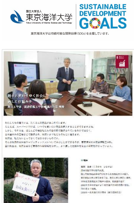
東京海洋大学 SDGs ホームページ https://www.kaiyodai.ac.jp/Japanese/SDGs/index.html

本学は、令和2年7月に「SDGs 展開準備チーム」を立ち上げました。本学の理念「人類社会の持続的発展に資するため、海洋を巡る学問及び科学技術に係わる基礎的・応用的教育研究を行う」の下、全ての人が幸せに暮らすことのできる社会を実現するために、本学のSDGsに関する活動を見える化する仕組みを構築し、中高生を含め広く社会に向けてわかりやすく発信することにしました。