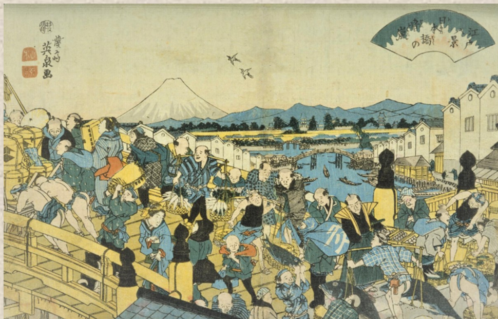
深斎英泉「江戸八景 日本橋の晴嵐」