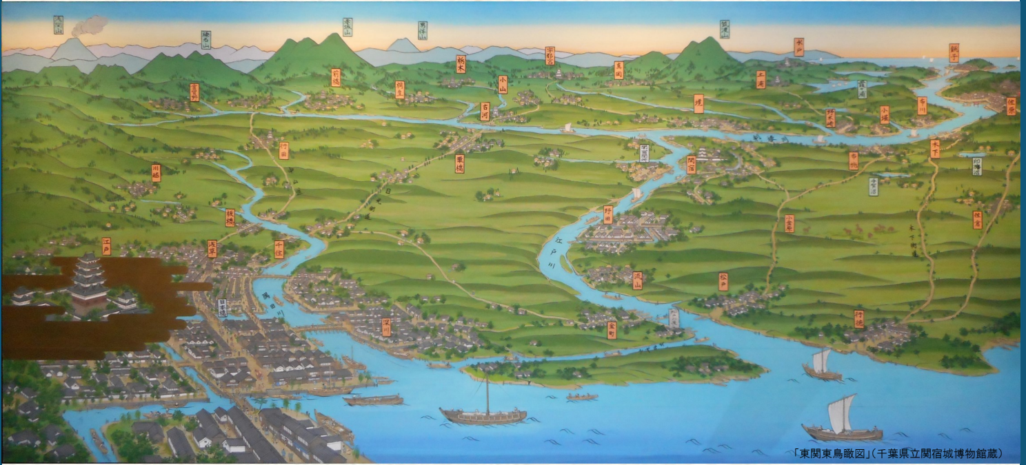
「東関東島図」(千葉県立関宿城博物館蔵)