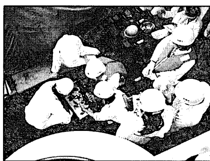
Photo.2 Fish Sorting

Run Hour 124-04、Total Distance 1719.8 miles、Drifting Hour 26-52 Average Speed 12.829 knot、Lay Hour 127-04