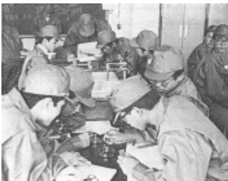
図 3. 魚体解剖と鱗の観察 (小樽水産高等学校生徒)