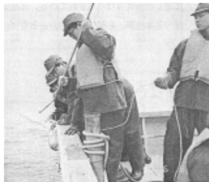
図 4. 海洋観測 (小樽水産高等学校生徒)