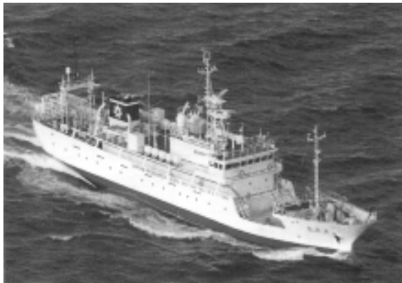
図 2. 北海道教育庁実習船管理局実習船『若竹丸』(666トン)

それだけに、水産業が文字通り誇りの持てる豊かな可能性を有する未来産業でもあるとの理解を広く若い世代の間に深め、かつ滲透させていく関係者の努力が今後ともに求められているのである。