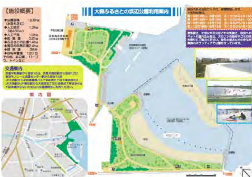
大森ふるさとの浜辺公園

当時は個人がカメラを持ちだした時代で、写真を撮った人もいました。漁業者自身が、公文書館や大学図書館などに行って、古い文書を読むことから始め、漁業史を勉強をして『大森漁業史』という本もまとめています。大森第一小学校はノリ生産者の子弟がほとんどで、昭和30年頃に生産の様子を16mmフィルムに撮影した先生もいました。地元の人たちが自分たちでつくったこういう資料は、地域の宝なんです。