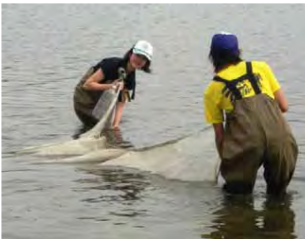
ふるはまで魚類調査の網を引く筆者（左）

5月から7月にかけて、月1回の計7回、投網を用いた魚類採集を行いました。また10月には、江戸前ESDの出張授業としてふるはまで小学生を対象に行われた学習の後、子供たちの環境意識がどのように変容したかをアンケートにより調査し、その2ヵ月後の12月、学びの広がりを知るアンケート調査を再び実施しました。