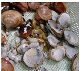
図1 チャクチ海底層に生息する貝類